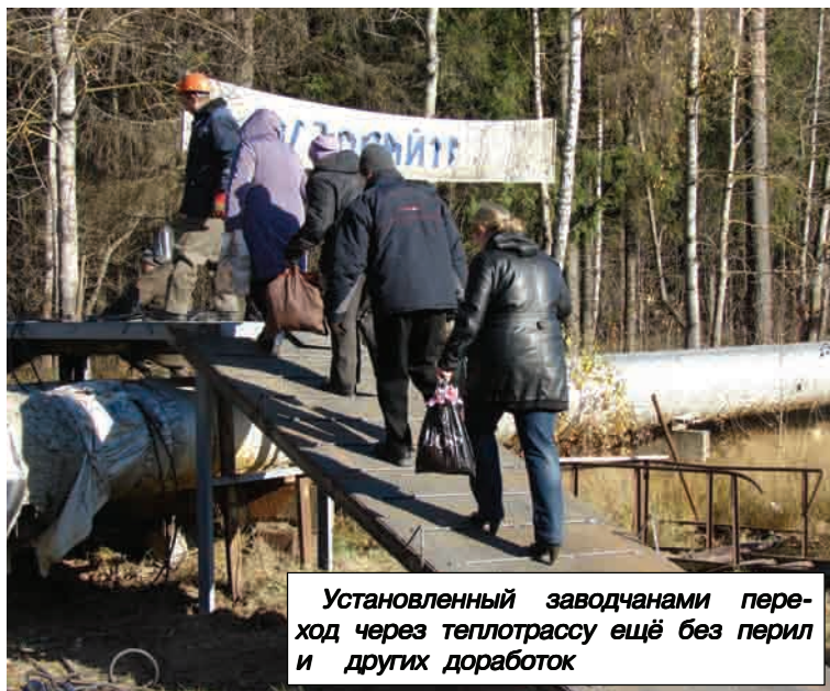
Установленный заводчанами переход через теплотрассу ещё без перил и других доработок